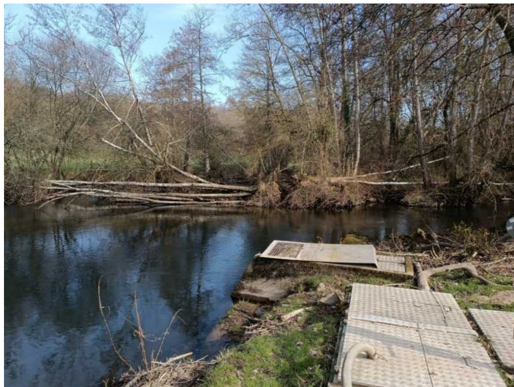
Grande Île Putanges