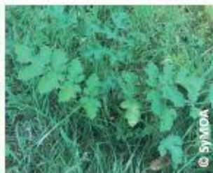
Feuille de Berce commune