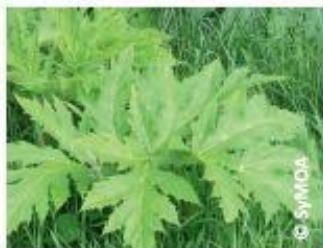
Feuille de Berce du Caucase

La confusion est possible avec la Berce commune : plante autochtone qui ne présente aucun danger, ni pour la santé ni pour l'environnement et que l'on trouve dans les prairies et sur les bords de routes et de chemins.