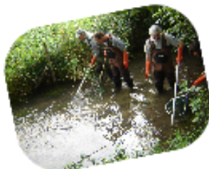
Pêche électrique sur l'Houay réalisée en 2010 par l'ONEMA