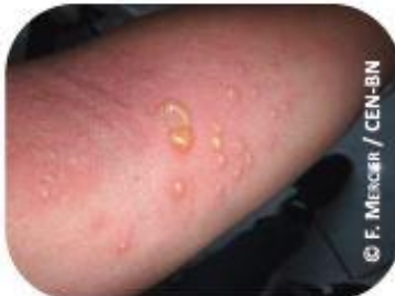
Brûlure due à la Berce du Caucase

Pour la nature : La Berce du Caucase est une espèce très compétitive et forme généralement des peuplements denses. Elle occulte la lumière et empêche les espèces voisines de se développer. Elle favorise également l'érosion des berges.