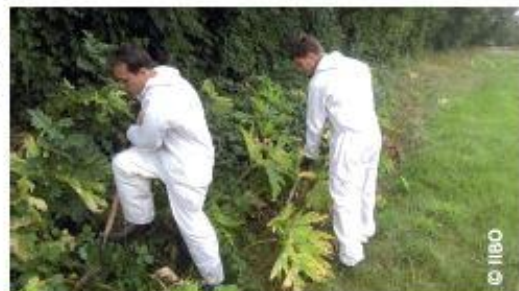
Brigade du CEN - Ruisseau des Landelles - Août 2015

Technique : les fleurs porteuses de graines ont été coupées et mises en sacs pour être incinérées. Les racines sont coupées à l'aide de bêches et laissés sur place avec tiges et feuilles pour séchage.